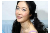
10大豪门弃妇今何在